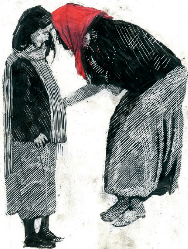
Immagine tratta dal film Invece di Simone Massi